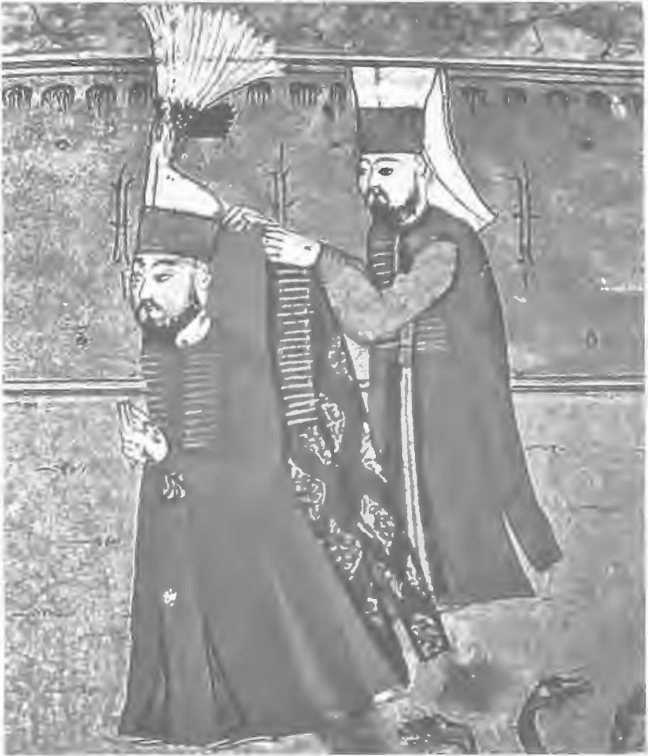
Resim 2. Surname. Divan üyelerine, bölük ağalarına, yaya ağalarına, bölük başlarına hil'at giydirilmesi. Topkapı Sarayı Kütüphanesi

Özellikle XVI ve XVII. yüzyıllarda çok kârlı bir yatırım olan dokumacılık, Osmanlı Devleti'nin en önemli gelir kaynaklarının başında geliyordu. Bu nedenle ipekli dokumalar ve dokumacılık devlet tarafından daima çok sıkı denetim altında tutulmaya çalışılmıştır. Bu sanatın standartlara sıkı sıkıya bağlı olan üretim aşamalarının kontrolü için kanunlar çıkartılmış ve buna bağlı olarak fermanlar yayınlanmıştır. Bursa Şeri sicillerinde yer alan 1643 tarihli vesikada devletin dokumacılığa verdiği önem ve üretim kalitesini korumak amacı açıkça görülmektedir.